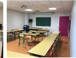
Salle de cours